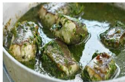
Paling in't groen